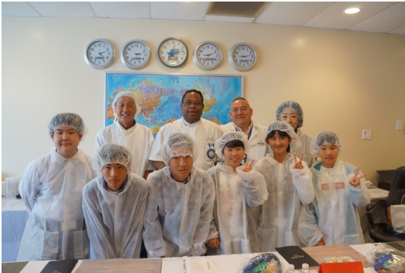
厳重な衛生装備で見学